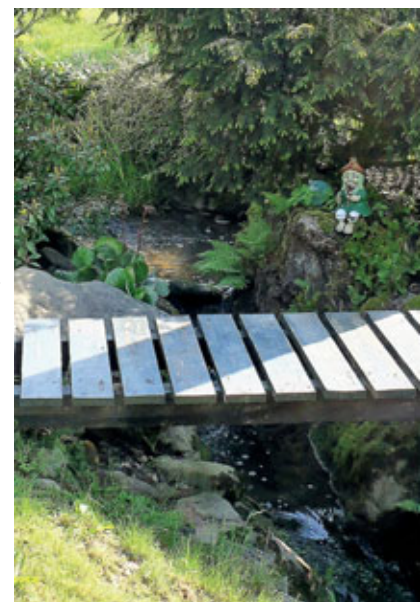
Ještě před rokem byl potok plný života

Mějte se hezky a nebudou-li vám brát ryby, zkuste houby. V lese je taky krásně!