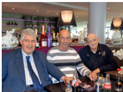
Členové nového vedení EAF na své první schůzi v Bruselu

rozpočtu ve výši 7231,53 EUR bude sloužit jako rezerva pro pokrytí případných vyšších výdajů v dalším období. Vedení EAF dále projednalo stav příprav letošního, v pořadí už 4. setkání mládeže EAF, které se bude konat v červenci ve francouzském Štrasburku. Tato tradiční akce je velmi pří-